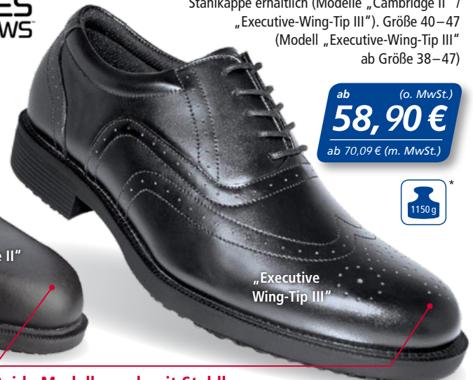
„Executive Wing-Tip III“

ab (o. MwSt.) 58,90 € ab 70,09 € (m. MwSt.)