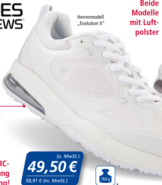
Herrenmodell „Evolution II“