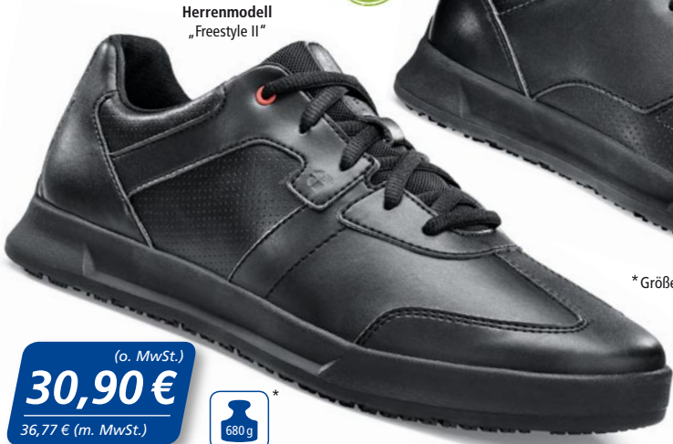
Herrenmodell „Freestyle II“