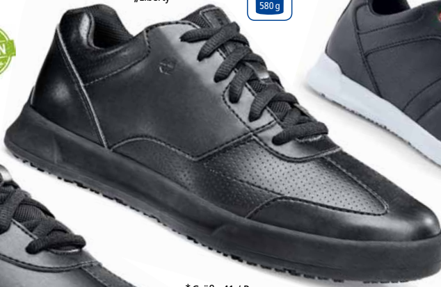
* Größe 41 / Paar