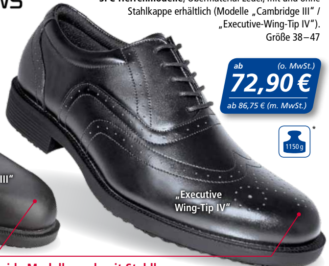
„Executive Wing-Tip IV“